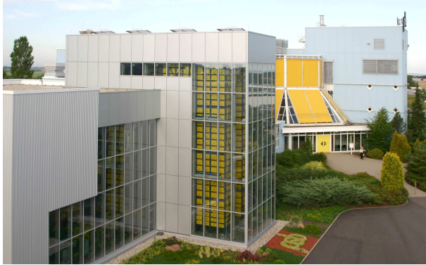
Blick auf das psb Präsentationsgebäude PRISMA Aufnahme psb intralogistics GmbH